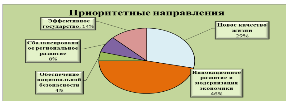
Рисунок 2.1. Ключевые блоки государственных программ